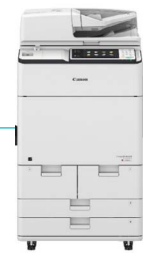
IR-ADV C7565i/ C7570i/C7580i